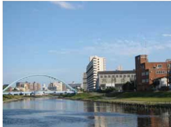
旧中川中流のふれあい橋付近。既に完成し、今年の夏も「灯籠流し」が行われて大勢の人々が集まりました。 < 視察コース図 >