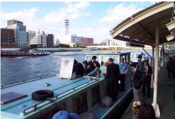
両国船着場から、2隻の船に分乗して視察に出発しました。 < 視察コース図 >