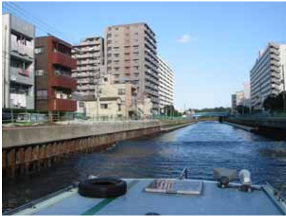
水位低下した東側の小名木川。マンション等に挟まれ、番所橋付近から整備が始まりました。 < 視察コース図 >