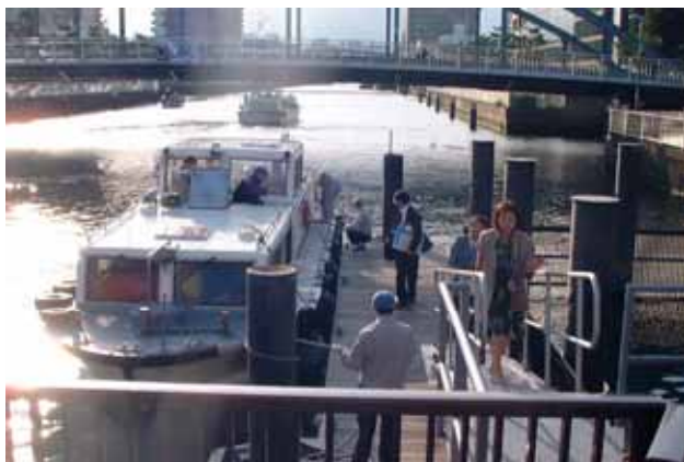
扇橋閘門の船着場で下船し、この後、歩いて会議場へ移動しました。 <視察コース図 >