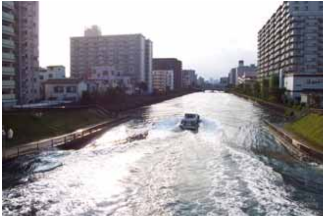
クローバー橋から西の小名木川は、川幅が広い。 手前は橋の取り付け工事で完成し、その前方は未整備です <視察コース図 >