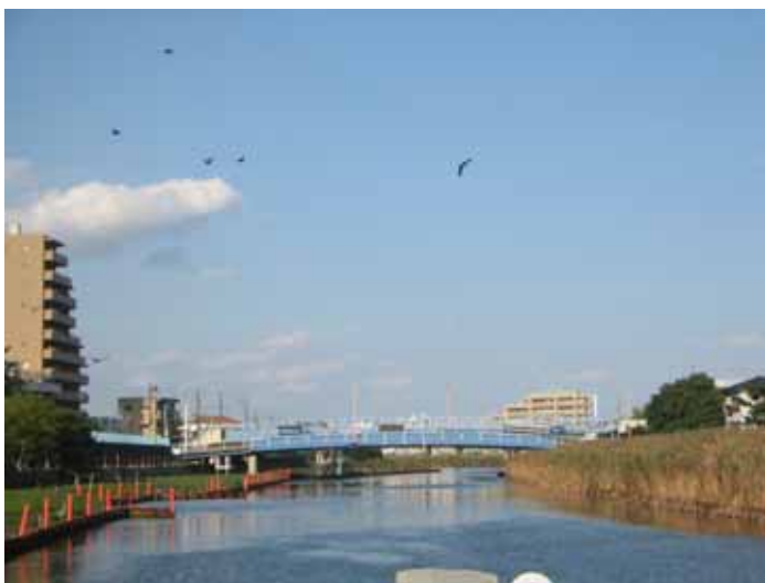
旧中川上流の平井橋付近。整備の途中ですがアシが茂っていて野鳥も見られます。 < 視察コース図 >