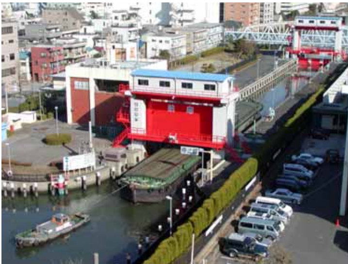
小名木川の東側は人工的に平常水位をAP. -1mに下げしており、潮の干満により西側と約1～3mもの水位差があります。このため、扇橋開門で2つの水門操作により水位を調節して船を通行させています。 < 視察コース図 >