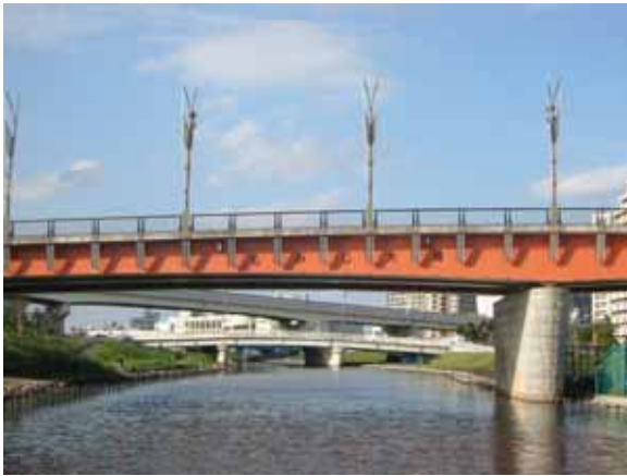
再開発で整備された亀戸・大島・小松川地区の真中を流れる完成した旧中川。休日には釣人も多く見られます。 < 視察コース図 >