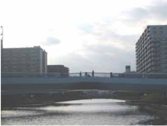
横十間川と交差する小名木川のクローバー橋付近。 9月に「水彩フェスティバル」が行われ、大変賑わいました。 <視察コース図 >