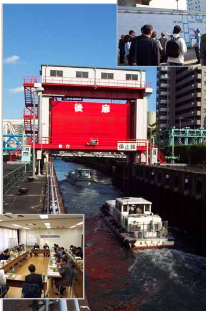
船による現地視察の様子