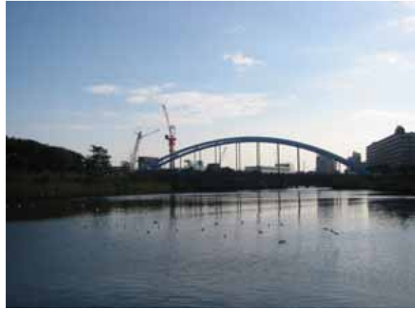
小名木川から入った旧中川下流の平成橋付近。橋の後方に荒川ロックゲートが工事中でした。 < 視察コース図 >