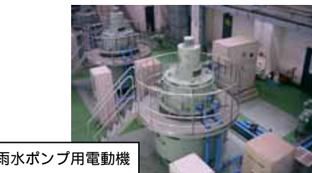
雨水ポンプ用電動機