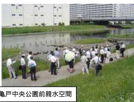
亀戸中央公園前親水空間