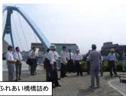
ふれあい橋橋詰め