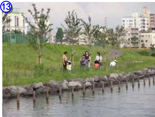
植栽された桜と散策利用