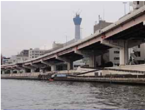
隅田川・両国付近より