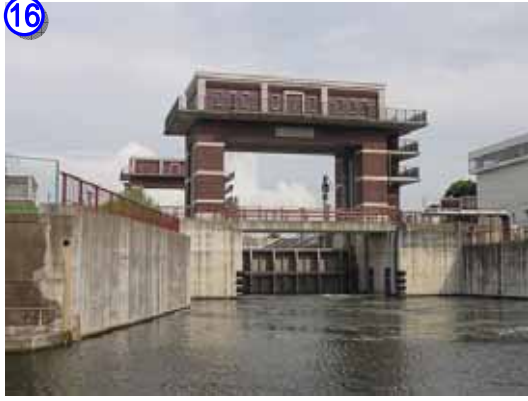
荒川ロックゲート