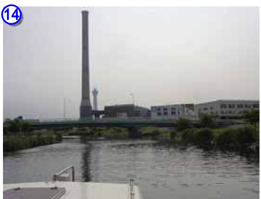
墨田区の清掃工場とスカイツリー