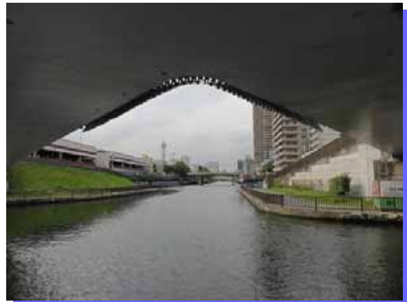
横十間川・小名木川・クローバー橋より