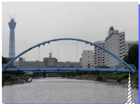
旧中川・ふれあい橋付近より