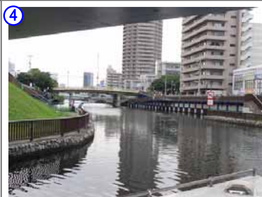
小名木川より横十間川に入る