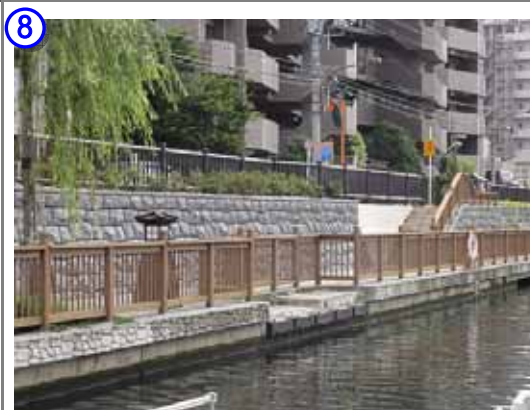
塩の道の整備箇所