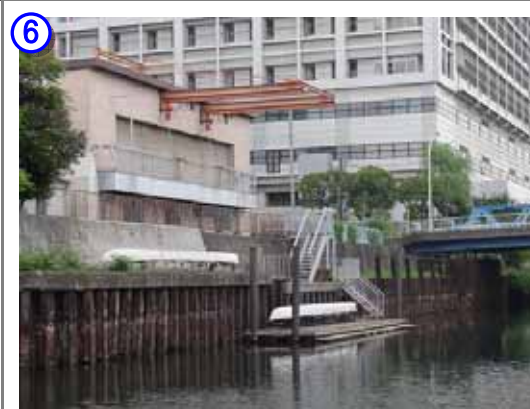
横十間川にある墨田区艇庫