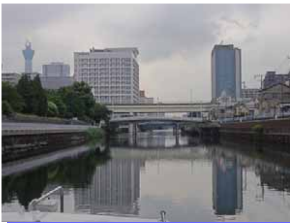
横十間川・猿江恩賜公園付近より