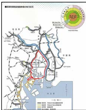
高潮防御施設の整備 (外郭堤防)