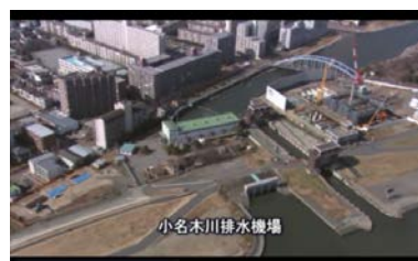
小名木川排水機場