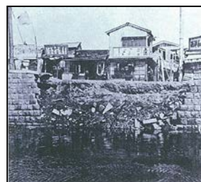
関東大震災による護岸崩壊