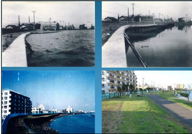
旧中川の整備状況（同地点）