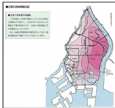
江東三角地帯概況図