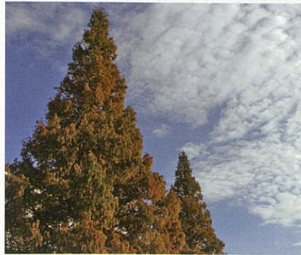
メタセコイア(紅葉)