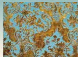
2階客室の金唐革紙。