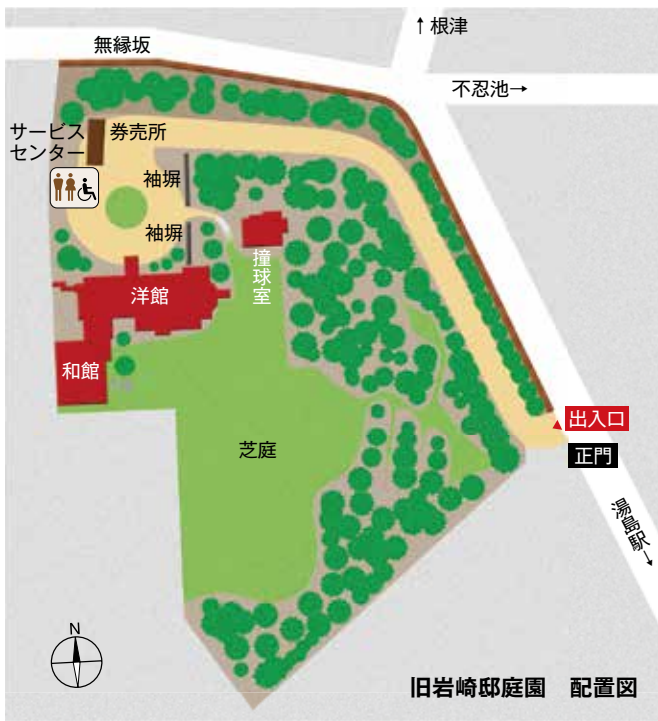
旧岩崎邸庭園 配置図