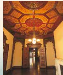
1階婦人客室天井はシルクの日本刺繍の布張りになっている。