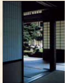
部材のひとつひとつに、現在では入手困難な木材が使われている。