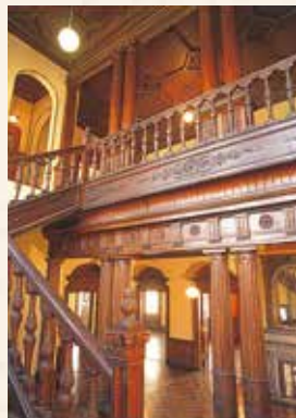
邸内細部にジャコビアン様式の意匠を見ることができる。

往時は、主に年1回の岩崎家の集まりや外国人、賓客を招いてのパーティーなどプライベートな迎賓館として使用されました。