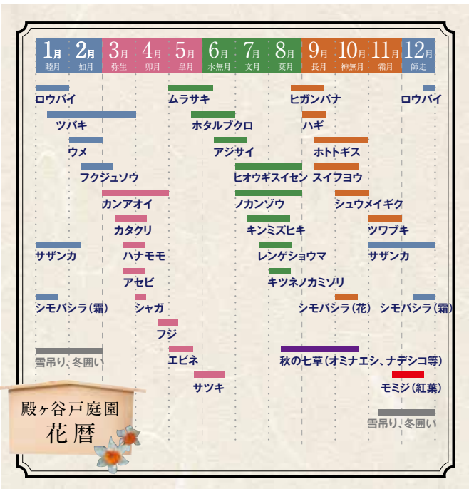
※開花時期は、その年の気象状況などにより左右されますのでご了承ください。