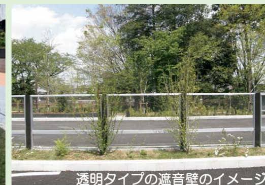
透明タイプの遮音壁のイメージ