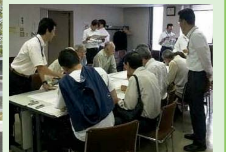
環境施設帯の話し合いの様子