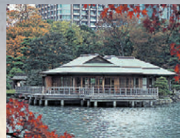
Shioiri-no-ike et Ochaya de Nakajima

Dès sa construction en 1707, ce pavillon recevait les shōguns et leurs épouses ainsi que des nobles venus se détendre dans une atmosphère relaxante grâce à la vue réjouissante du jardin. Le bâtiment actuel est une reconstruction datée de 1983. Aujourd'hui on y sert le Maccha (thé vert) accompagné d'un gâteau japonais. (Hors tarif d'entrée).