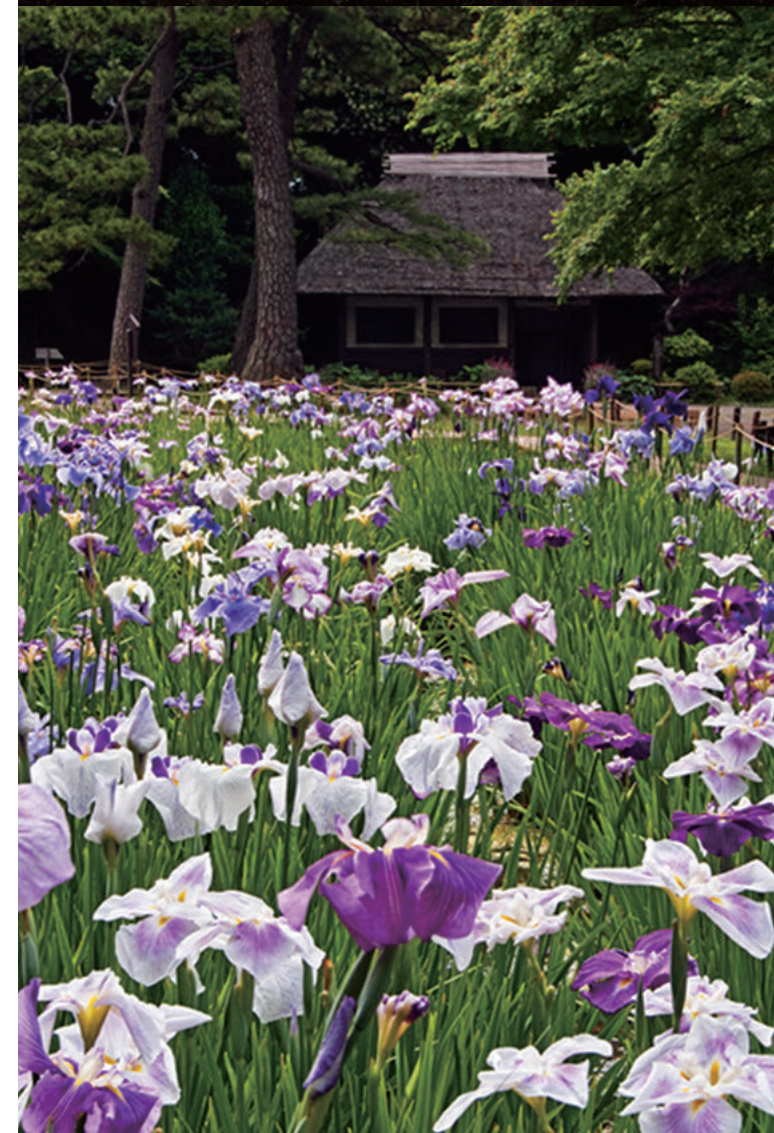
Organe gestionnaire: Association Municipale des Parcs et Jardins de Tokyo (Fondation d'Utilité Publique avec la Personnalité Juridique)

Jardin style Daimyo (seigneur féodal) de Tokugawa Mitsukuni