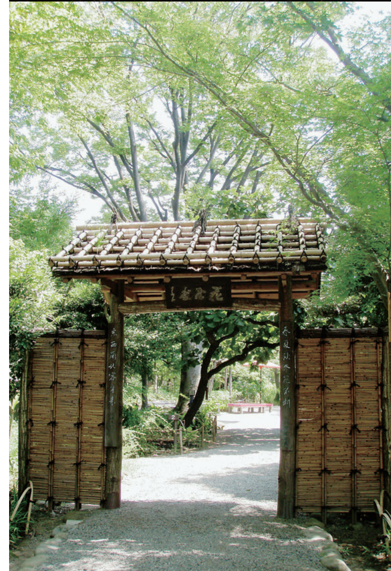
Organe gestionnaire: Association Municipale des Parcs et Jardins de Tokyo (Fondation d'Utilité Publique avec la Personnalité Juridique)