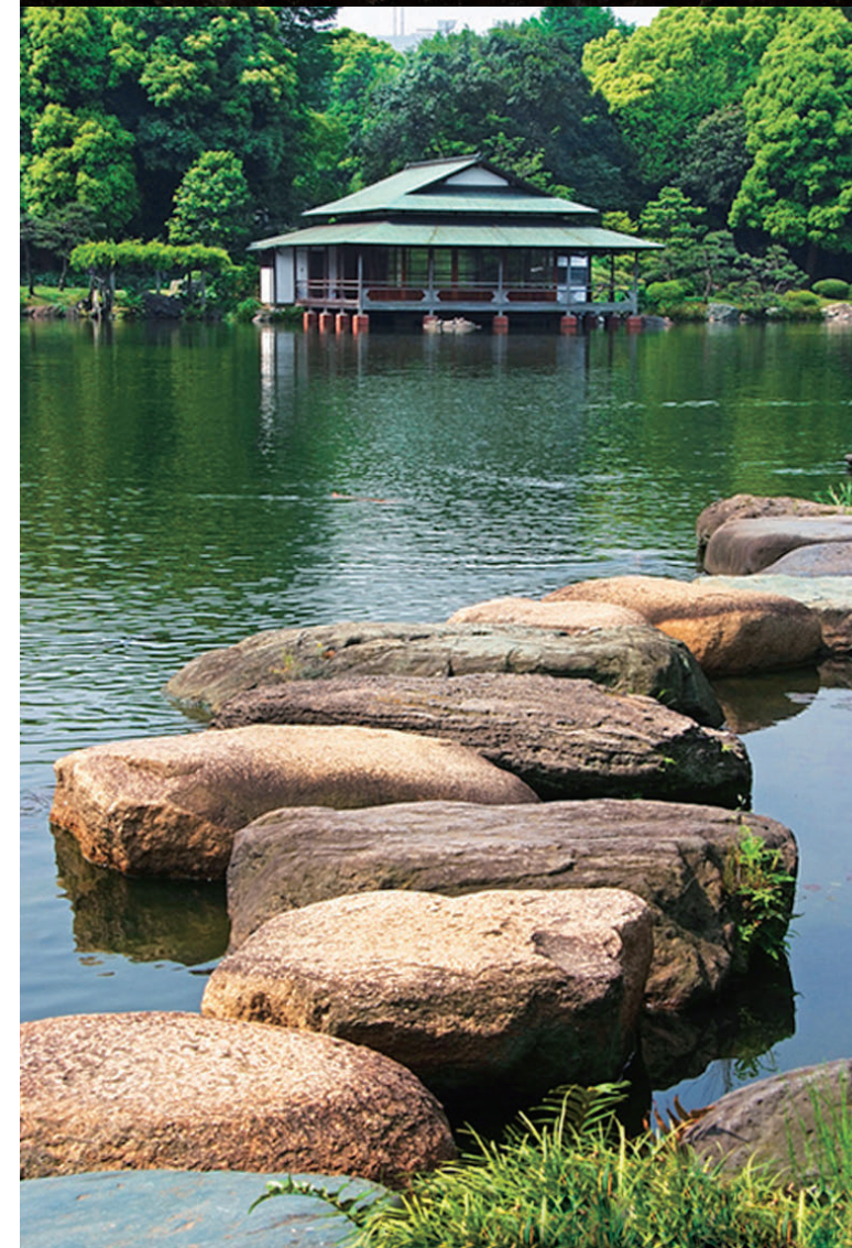
Organe gestionnaire: Association Municipale des Parcs et Jardins de Tokyo (Fondation d'Utilité Publique avec la Personnalité Juridique)

Jardin de rochers édifié à travers les trois générations de la famille Iwasaki