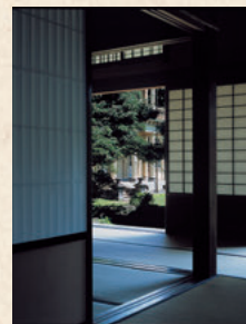
建筑材料上均使用现今难以得到的珍贵木材。