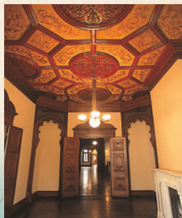
一层东侧客厅天棚上装饰有丝绸的日本刺绣。