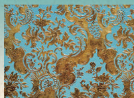
2楼会客室的金唐革纸