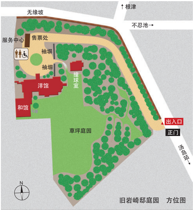
旧岩崎邸庭园 方位图