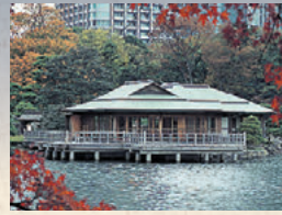
潮入之池和中島之茶屋

自永寶 4 (1707) 年落成以來，此處便成為了將軍以及夫人們、貴族們永不厭倦的觀賞園內美景的休息場所。現在的建築於昭和 58 (1983) 年復原重建。在此可以品嚐到抹茶、點心的套餐(收費)。