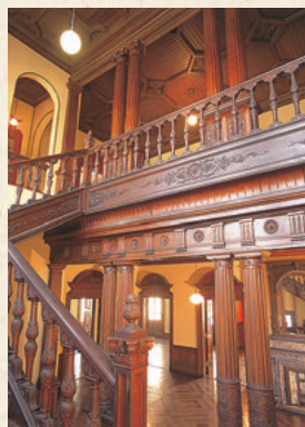
府邸內細微處可見詹姆士一世時期樣式的別具匠心。