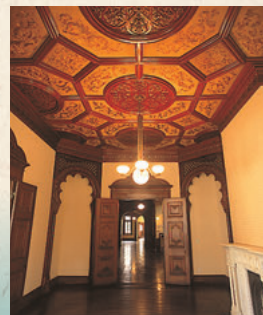
一層東側客廳天棚上裝飾有絲綢的日本刺繡。