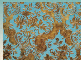
2樓會客室的金唐革紙