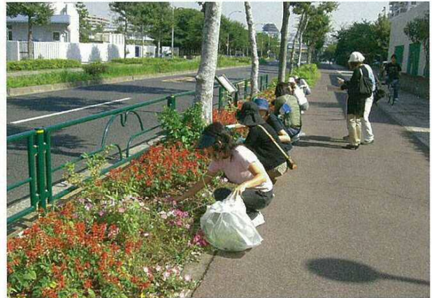
▲ 第4回 地域主導のみちづくりフォーラムより活動風景 左：環八に花と緑をの会 右：江戸川区立清新第一小学校