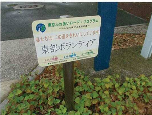
▲サイン（表示板）の例