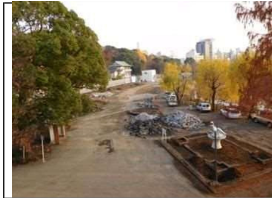
ゾーン整備施工前

他の業種を含め最大10社が同時に施工する競合した現場において、ゾーン整備全体の工程を優先しつつも、割り当て時間を有効に活用し工事を円滑に進めた。サイン板面のデザインや色調について、関係機関からの要望に対し積極的な提案を行う等、誠実な取り組みにより適切に施工することができた。