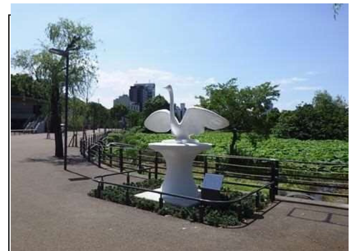
モニュメントの移設・修復後

技術者として工事の現場を担うことは、大変なことが多いですが現場を通じて多くのことを学ぶことができますので、思い切って挑戦してほしいと思います。