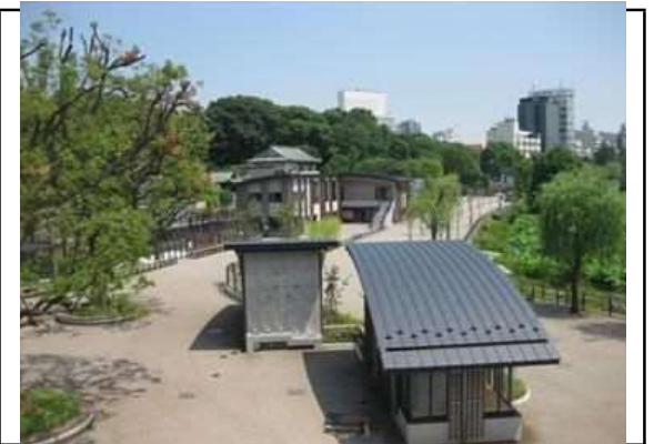
ゾーン整備施工後