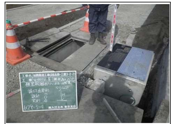
既設電線共同溝特殊部柵

工事に対する地元住民の反対等、住民対策には苦慮しますが、道路が出来上がった時の達成感は苦労より勝るものがありましたので、途中で投げ出すことなく、この業界での仕事を継続してほしいと思います。