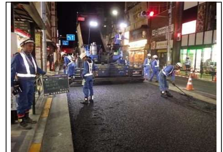
バス停留所前車道施工状況

一見不可能に思えることでも、はじめからあきらめるのではなく果敢に挑戦する意識をもって何事にも取り組んでいただきたいと思います。