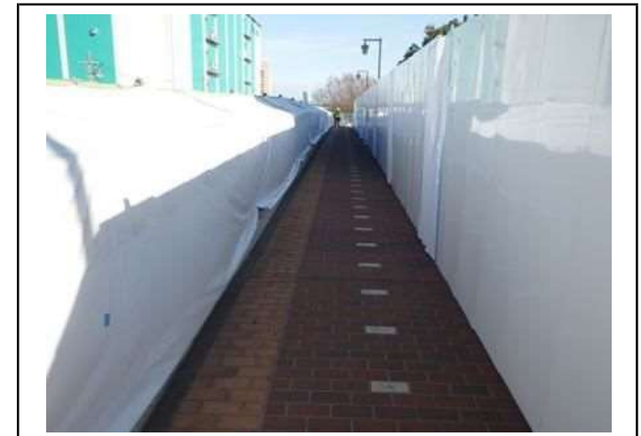
塗膜除去作業時のアドフラットパネル設置状況

建設業においては、仕事のきついところは、確かにあると思いますが、その分、工事が完成した時の達成感もあると思うので、頑張してほしいと思います。