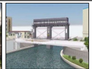
連続橋完成イメージ