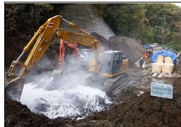
崩落土安定処理状況

若い方々は、難題にぶつかった時、若い少ない経験で判断し直ぐあきらめないでとことん試行錯誤して欲しいと思います。あきらめなければ、必ず大きく得るものがあります。協力し知恵を与えてくれる仲間が出来るはず。これら全てが自分の後の大きな財産になるはず。です。