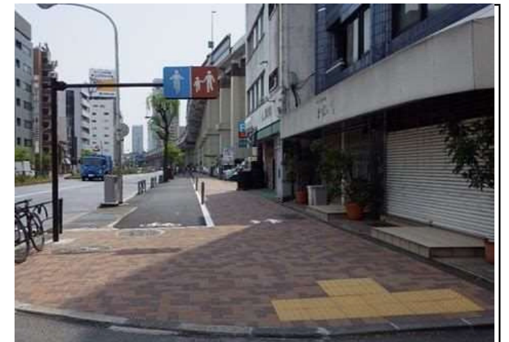
自転車走行空間整備

各現場、現場に合った施工計画を行って、現場を管理し施工します。同じ現場はありません。AI（人工知能）では、まだまだできない仕事だと思います。苦労のある仕事かもしれませんが、やりがいのある仕事です。