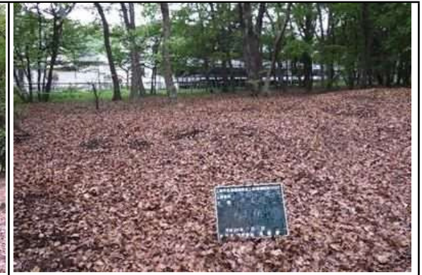
半倒木伐採・抜根 施工後