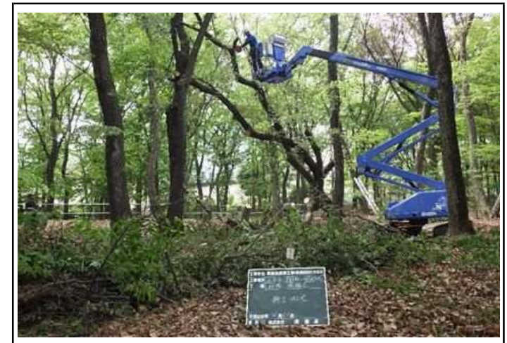
不整地走行型・高所作業車による、かかり木処理

建設業の中で土木工事の原点（基本）は道路建設と考えます。様々な困難などがあると思われませんが、先人の知恵をかり、夢と希望をもってかがやく人になって下さい。