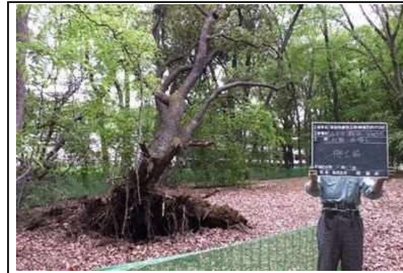
半倒木伐採・抜根 施工前

・現場代理人は、複数の指示が連続した場合及び突発的な苦情に対しても、施工体制を速やかに整え円滑に工事を進めた。また、緊急性を要する指示に対しても、監督員と綿密に連絡を取り合い、人員及び機械配置、資機材手配等を速やかに行い現場着手した。業務に対する熱意と創意工夫が随所にみられ、他の模範となるものであった。