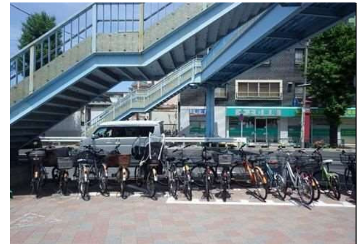
桁下駐輪場利用状況（上町歩道橋）