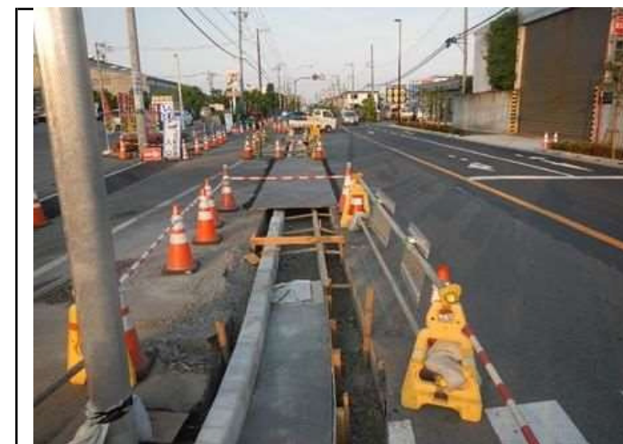
夜間開放時の保安柵設置状況