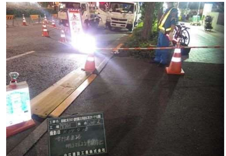
管路設置工（後楽橋交差点歩道内掘削）施工時のスロープマット及び照明設置状況