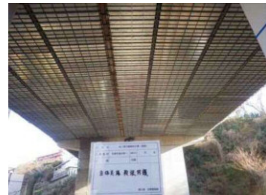
仮設足場板張り防護設置状況（全面SKパネル採用）

1965年以降新しい道路・橋梁等が次々と建設されてきたが、今それらの維持工事が 必要不可欠になっています。建築物の寿命を延ばすため、力になってもらいたい。