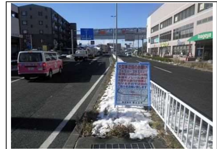
工事看板設置(日野バypass)