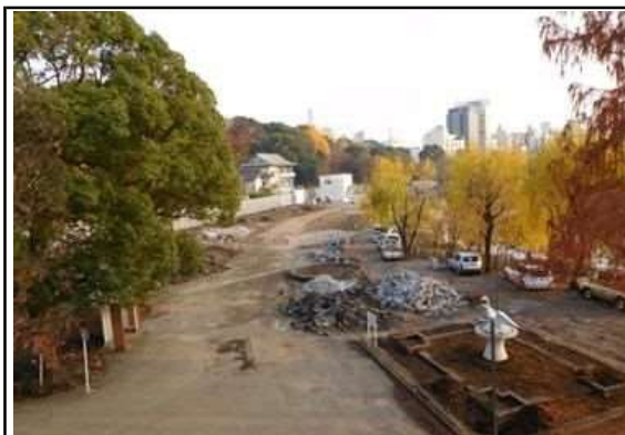
ゾーン整備施工前

他の業種を含め最大10社が同時に施工する競合した現場において、ゾーン整備全体の工程を優先しつつも割り当て時間を有効に活用して工事を円滑に進めた。特に、曲線のコンクリート型枠においては、支保工に独自の工夫を凝らすきめの細かい施工を丁寧に行うなど、仕上がりが良好であった。