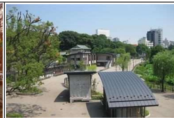
ゾーン整備施工後