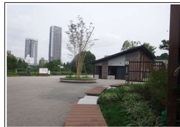
植栽及び植栽ウォール（曲線）