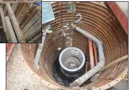
鉄筋コンクリート管設置工及び人孔設置工