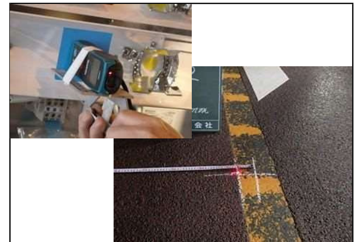
レーザーポインタ照射状況

どの業種でもそれなりにあるでしょうが、建設業で責任を持って完工したときの充足感には換え難いものがあり、楽しい