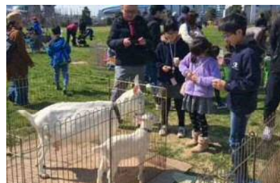
自主事業イベント「ふれあい動物園」