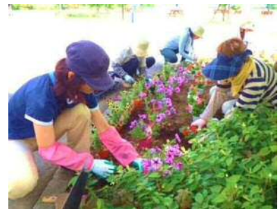
ボランティアによる花壇の管理