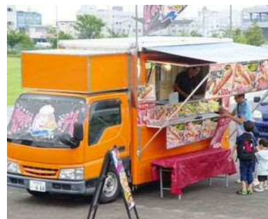
キッチンカーの誘致によるオープン空間の創出