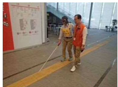
障がい者への対応研修