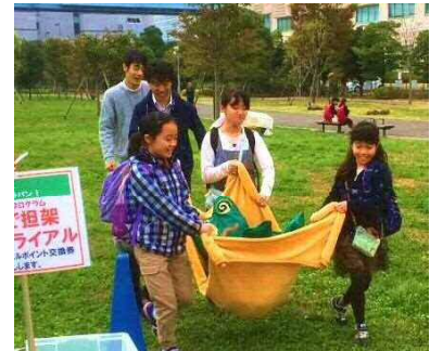
参加型防災体験学習プログラム