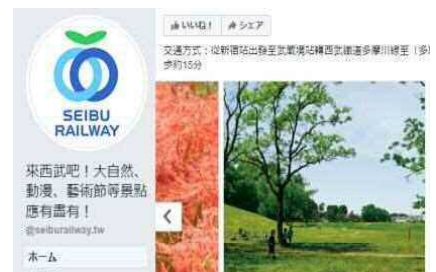
西武鉄道の中国語(繁体字)版 Facebook 武蔵野の公園グループ掲載実績