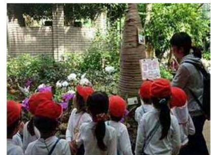
「アロア・ウッド」を楽しむ子どもたち (小田原市小田原フラワーガーデン)

当法人が管理運営に参加する小田原市小田原フラワーガーデンでは、体験学習プログラム「アロア・ウッド探検隊」を開発し、常設プログラムとして展開しています。このプログラムは、ストーリー性のあるクイズを解きながら館内の植物・展示・見どころなどに設置されたチェックポイントを巡るセルフガイド形式の体験プログラムです。このようなプログラムを本公園でも実践し、都防災の未来を担う人材育成の場とします。