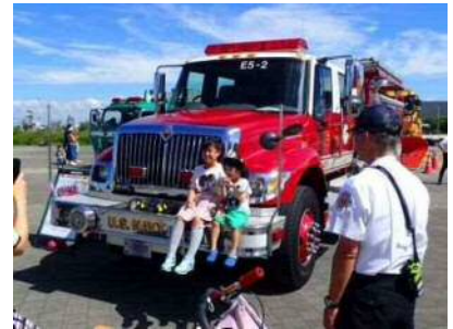
ぼうさいモーターショー