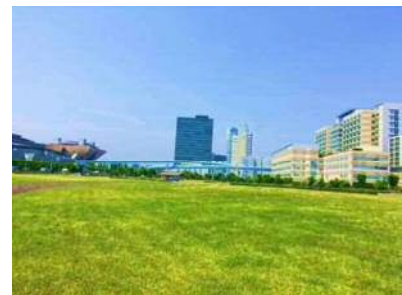
有明地区の貴重な緑の拠点