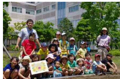
笑顔あふれる コミュニケーション