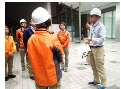
定期的な避難誘導訓練の実施