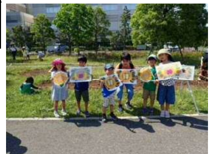
「はるかのはまわり」植付け体験

前述の「花咲きプロジェクト（仮称）」をはじめ、都民や地域との協働・連携等による公園の花修景をより一層充実させ、彩りある景観で利用者を迎えます。また、利用者ニーズや公園の利用方法にあわせた維持管理で「利用者目線の公園づくり」を行います。