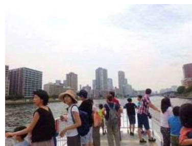
都立横網町公園等と連携した「夏休み水上バスで行くぼうさいツアー」