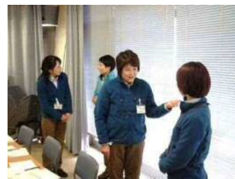
ロールプレイング研修 (西東京市立公園)