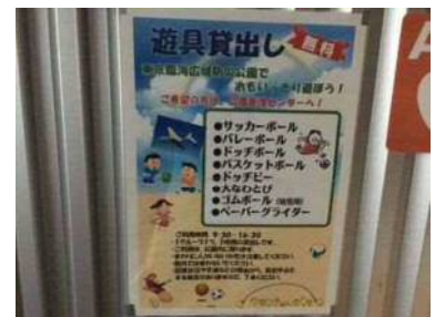
遊具の無料貸し出し