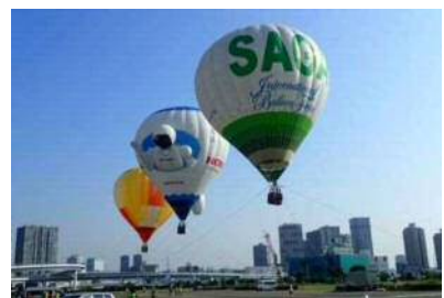
広大な園地を使ったイベント

本公園の特徴といえる広大な園地をはじめとする各施設を活用し、より多くの方に公園をご利用いただけるような利用促進プログラムを実施し、満足度の向上を目指します。