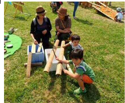
子どもたちのプレイパーク