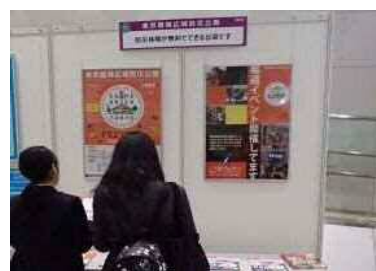
「ぼうさい国体」への出張出展