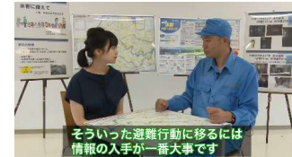
そういった避難行動に移るには情報の入手が一番大事です