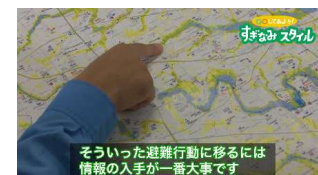
そういった避難行動に移るには情報の入手が一番大事です