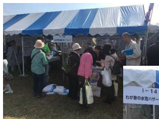
イベントでの周知の様子