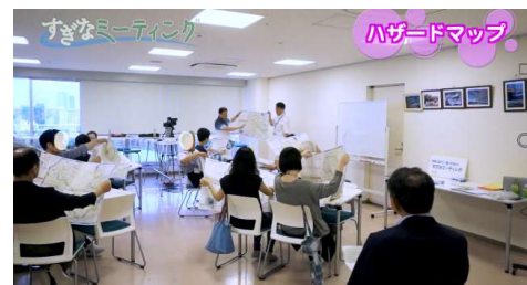
水害ハザードマップ講習会の様子