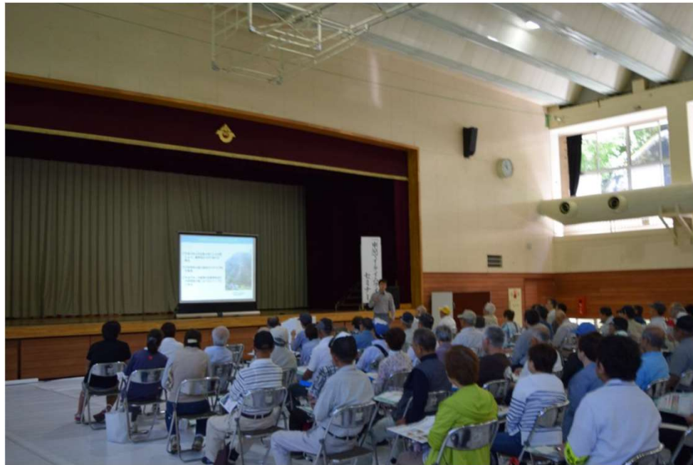
東京マイタイムラインのセミナー