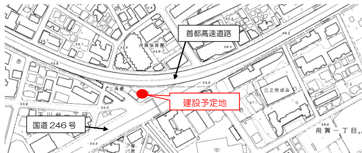
建設予定地案内図