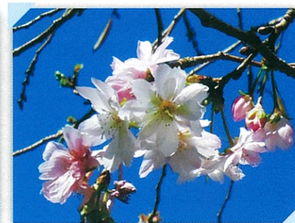
ジュウガツザクラ