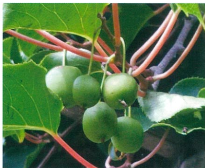
サルナシ (猿梨) マタタビ科マタタビ属 Actinidia arguta

サルナシは、雌雄異種または雌雄雑居性の落葉性つる植物。山間地に自生するがマタタビより数は少なく見つけるのが難しい。実は小粒のキウイフルーツの様である。中国に自生するシナサルナシをニュージーランドに持ち込み品種改良したのがキウイフルーツである。