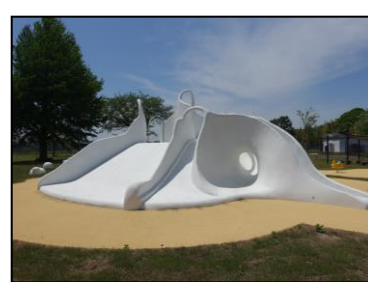
写真-3 スカルプチュア遊具竣工後