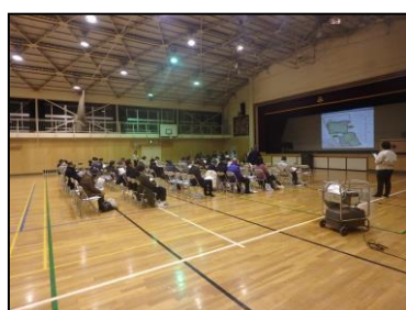
写真-1 工事説明会の様子

今回紹介した事案以外にも多数の課題に直面したが、現場での工夫を重ね、令和2年6月1日に無事に開園を迎えることができた。特別区内における新規の都立公園の開園としては、約10年ぶりとなる。開園日は小雨にも関わらず子供たちが遊ぶ姿が見られ、現在も多くの来園者で賑わいをみせている。今後も良好なレクリエーションの場の提供に少しでも寄与できるよう事業推進を図っていく。