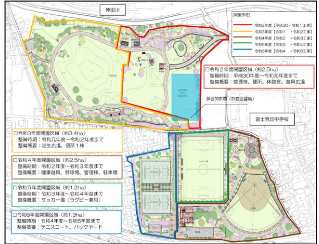
図－1 高井戸公園 整備計画図

高井戸公園は、杉並区久我山に位置する都市計画面積 17.4ha の都立公園である。計画区域の一部（10.9ha）は、これまで企業等が所有する運動グラウンドであったが、平成 24 年度に事業認可を取得し、平成 26 年度までに用地取得を完了した。取得した 10.9ha は令和 6 年度までに順次整備と開園を予定している。（図－1）当課では平成 30 年度より工事を開始したが、近隣からの多くの要望や、近年類をみない大規模な整備面積で複数の工種が交差する工事であったため、完成までに多くの課題が発生した。本発表では、令和 2 年 6 月の新規開園に至るまでに発生した課題や対応策などの取り組みについて報告する。