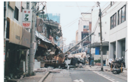
阪神淡路大震災時の道路状況