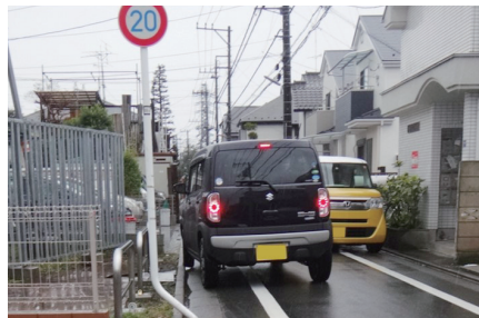
二枚橋の坂（市道573号）

通過交通が生活道路に 侵入し、歩行者や自転車にとって危険な状況 となっています。