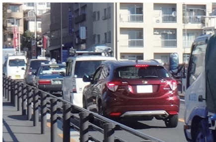
小金井街道 前原坂の渋滞状況

南北方向の幹線道路がないため、小金井街道や新小金井街道等で 渋滞が発生 しています。