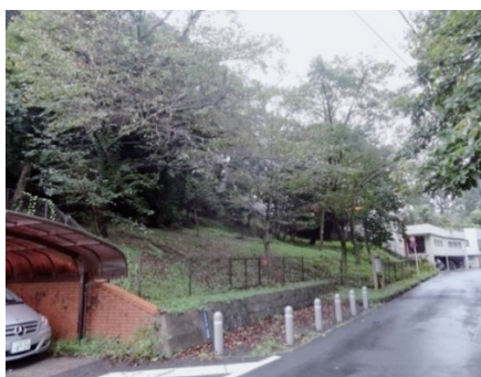
国分寺崖線（はけ）・はけの道