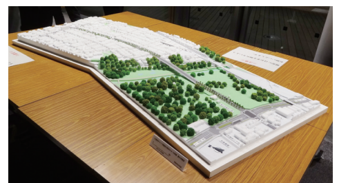
オープンハウスで展示したパネルや模型