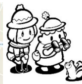
ひゃくさいくん・ひゃっこちゃん