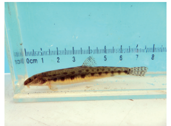
ヒガシシマドジョウ