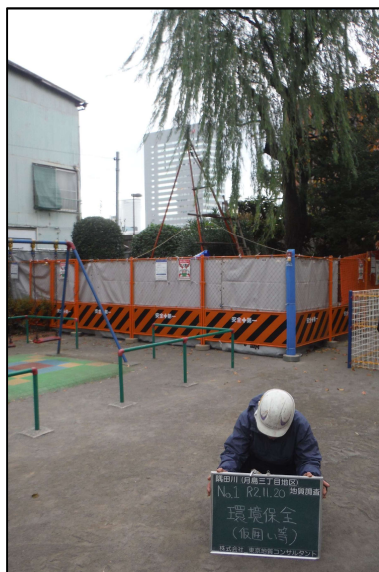
【公園内仮囲い設置状況】