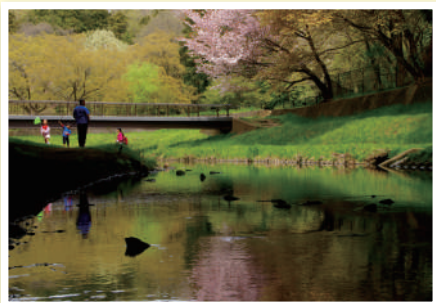
川のフォトコンテスト応募作品