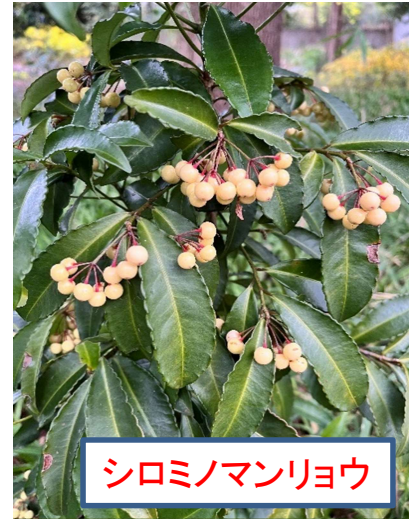
シロミノマンリョウ