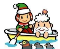
ひゃっこちゃん・ひやくさいくん

※花便りに関するご質問は、井の頭恩賜公園案内所(Tel.0422-47-6900)までお問い合わせください。