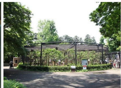
リスの小径(井の頭)