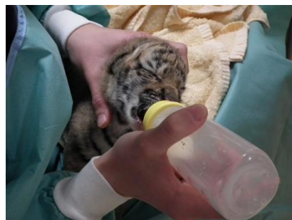
アムールトラの繁殖(多摩)