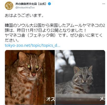
アムールヤマネコの導入と公開 (井の頭)