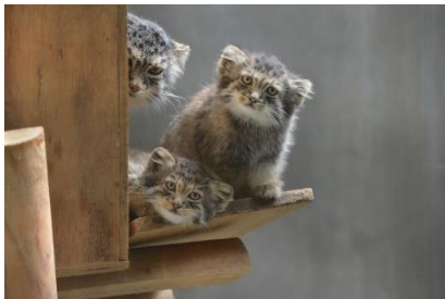
マヌルネコの親子(上野)