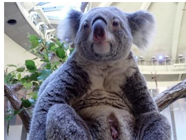
コアラの親子(多摩)