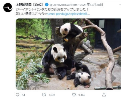
ジャイアントパンダ情報提供 (上野)