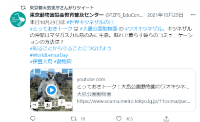
「とっておきトーク」動画配信 (上野、大島)