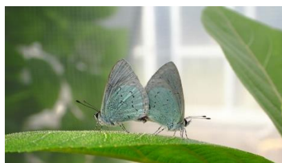
オガサワラシジミ(多摩)