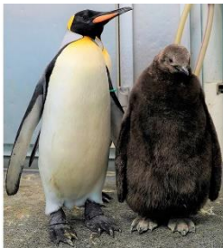
オオサマペンギンの誕生 (葛西)