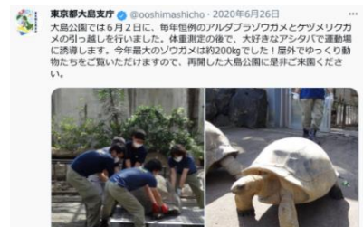
ゾウガメの引っ越し(大島)