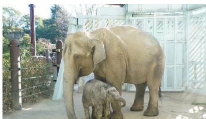
アジアゾウの親子(上野)