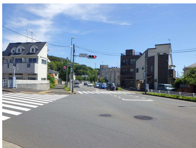
整備済み区間(並木交差点)