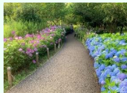
アジサイの小径 (イメージ)