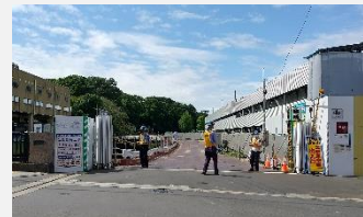
完成した豊島園通り出入口と交通誘導員の様子

工事車両を通行させるための切り下げ工事を行いました。出入口には交通誘導員を配置し、安全に配慮して工事を進めています。