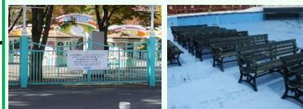
としまえんのベンチを再利用したり、正門の一部をモニュメントとして活用する予定です。