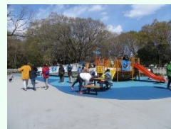
遊具広場 (イメージ)