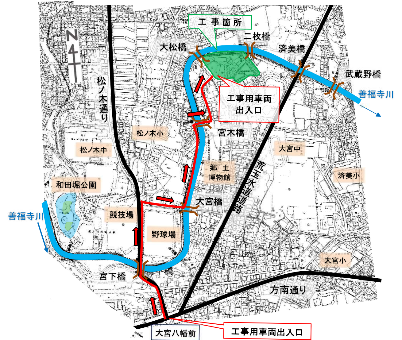
位置図及び工事車両ルート図