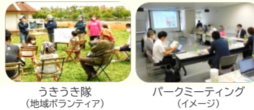
うきうき隊 (地域ボランティア)