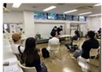
密を回避した形式での抽選会